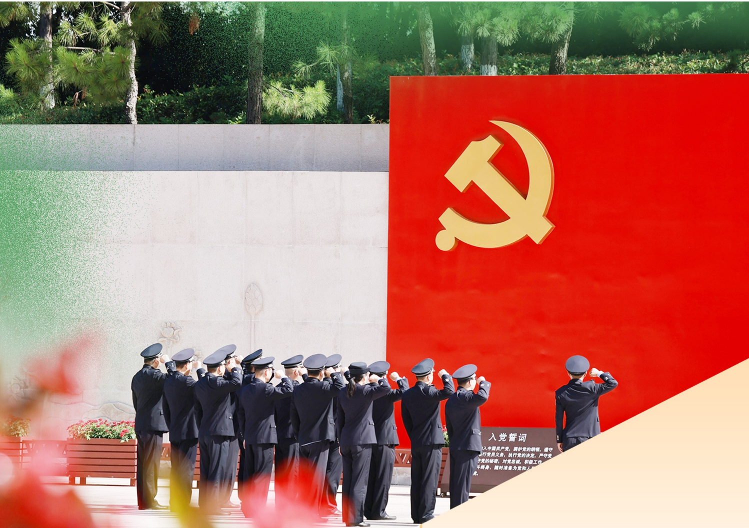
2023年6月28日,浙江省嘉兴市公安局南湖区分局七一出所组织民警在南湖革命纪念馆举行重温入党誓词主题活动。