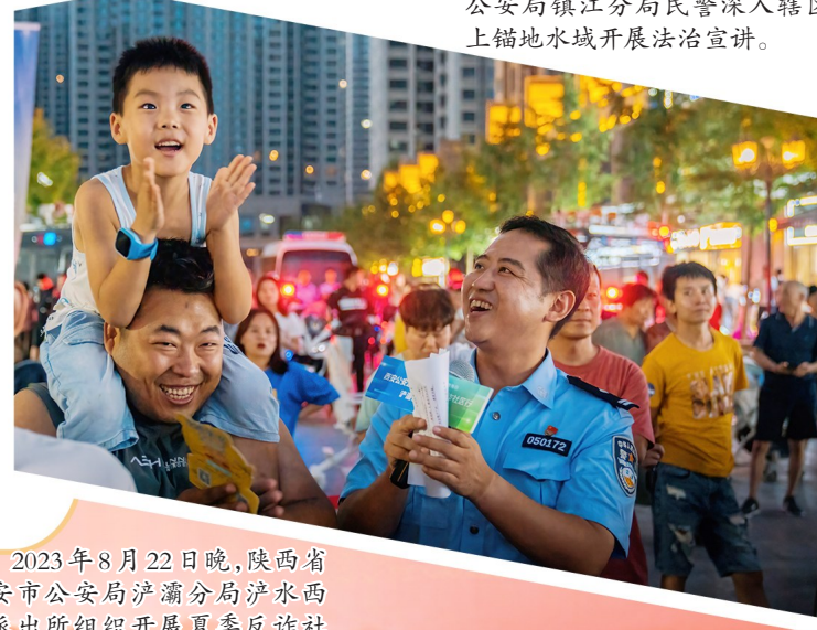
2023年8月22日晚,陕西省西安市公安局浐灞分局浐水西路派出所组织开展夏季反诈骗社区行活动,提升群众反诈意识。