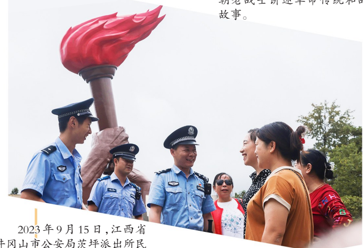
2023年9月15日,江西省井冈山市公安局茨坪派出所民警联合特巡警大队队员在南山公园的火炬广场巡逻,与游客交流。