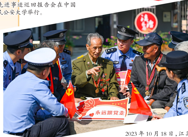
2023年10月18日,江苏省宜兴市公安局民警聆听抗美援朝老战士讲述革命传统和战斗故事。