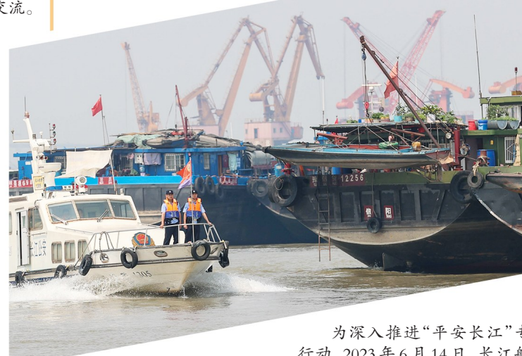
为深入推进“平安长江”专项行动,2023年6月14日,长江航运公安局镇江分局民警深入辖区水上锚地水域开展法治宣讲。